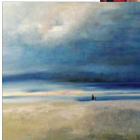
Moren. Menneskets litenhet i den store naturen. På grunn av trykken fremkommer ikke bildets farger helt lik som originalen.