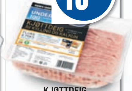
KJØTTDEIG AV KYLLING OG KALKUN 400 g, 47,50 pr. kg