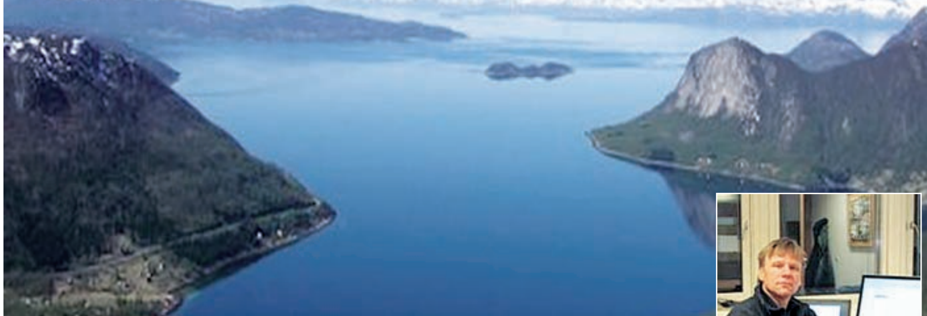
Bietsisjsuolaj guovddelin vuojnnu Lofotvárijn duogátjin. Bekkenesholmen sees i midten av bildet med Lofotveggen i bakgrunnen

Tæksta: Åse Haraldsen Järggálibme: Giella AS