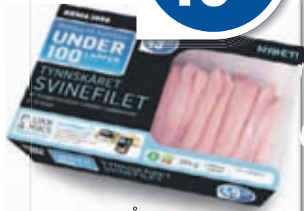
TYNSKÅRET SVINEFILET Skivet, Nordfjord, 384 g, 127,60 pr. kg