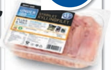
STRIMLET KYLLINGFILET Solvinge, 400 g, 122,50 pr. kg