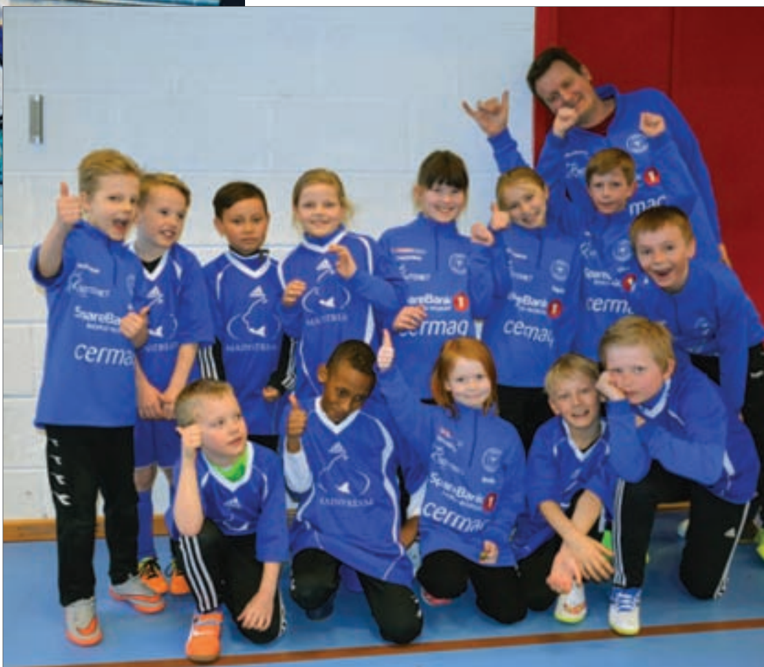
Steigen MP10. Knallartig! Tommelen opp fra Steigen-spillere, som gjerne tok en lang dag i Stetindhallen og ga full innsats.