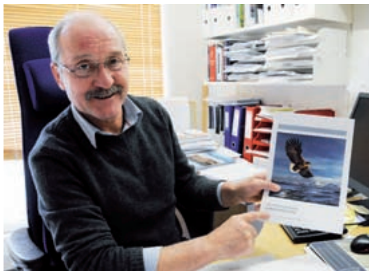
Her sitter ordfører Asle Schrøder med den politiske plattformen for Ytre Salten-alternativet som Steigen kan bli en del av.

Ordfører Asle Schrøder (Sp) mener fortsatt at det er rett å be folket i Steigen om sin mening om eventuell kommunesammenslåing, selv om det denne uka ble kritisert av blant annet departementet.