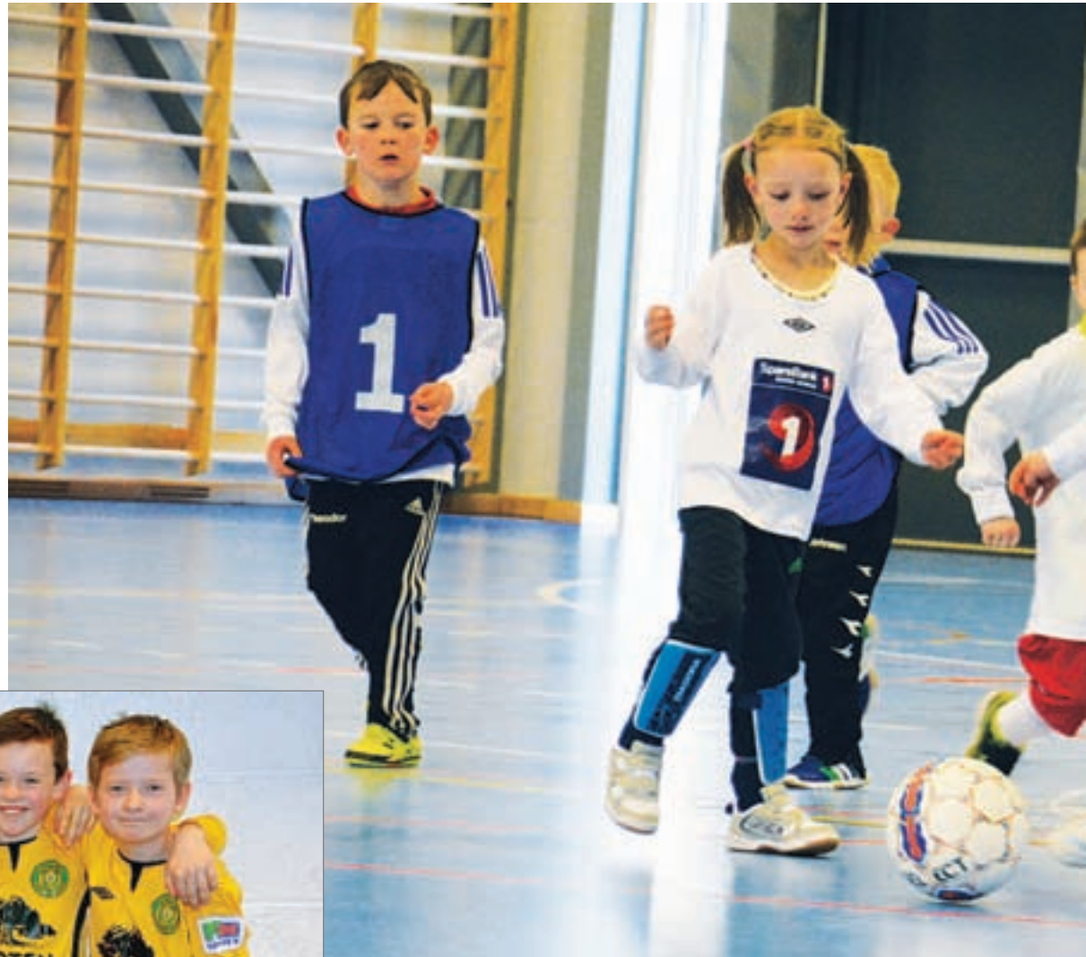
Spilleglede. Under årets Energicup i Stetindhallen var det fokus på spilleglede