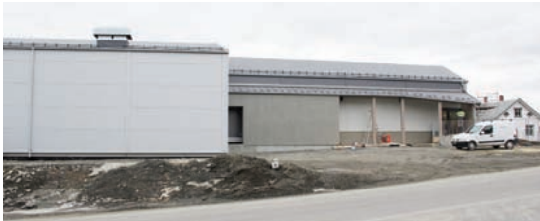
Fasade: 15. april legges siste hånd på verket både innvendig og utvendig.

21. april inviteres hele lokalsamfunnet til å være med på åpningen av nybutikken.