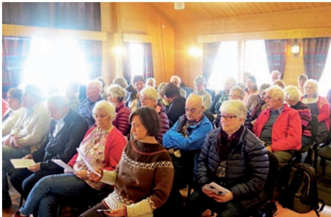
Fornøyd publikum i Steigen. De fleste publikummerne var av den eldre garde. De ga velfortjent applaus til de flinke artistene.

for slike konserter kvikker opp tilværelsen for oss som begynner å dra på årene, og bidrar til å holde liv i musikere og sangere som ofte har problemer med å få tilstrekkelig med oppdrag.