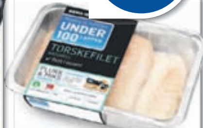
TORSKEFILET NATURELL ca 500g, 112,00 pr. kg