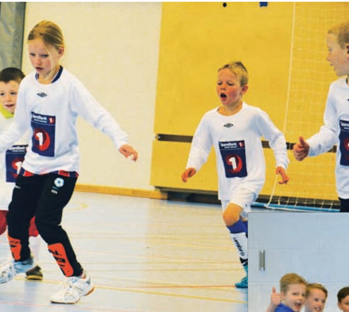
da rundt 250 spillere i alderen 1. til 10. klasse møttes sist lørdag.