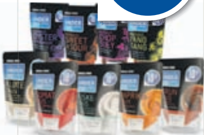
UTVALGTE SAUSER 220ml/230g, 45,45 pr. l / 43,48 pr. kg