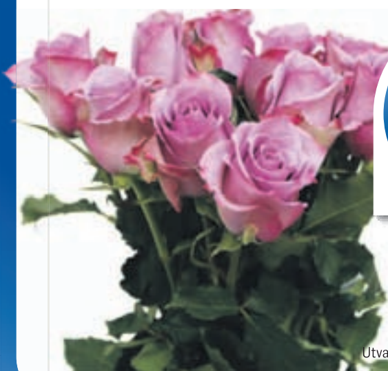
ROSER 10 PK Utvalgte farger, 79,00 pr. bukett

Gjelder Nordland til og med 09.04.2016 - Kun til private husholdninger. Vi tar forbehold om eventuelle trykkfeil og at noen varer kan være utsolgt.