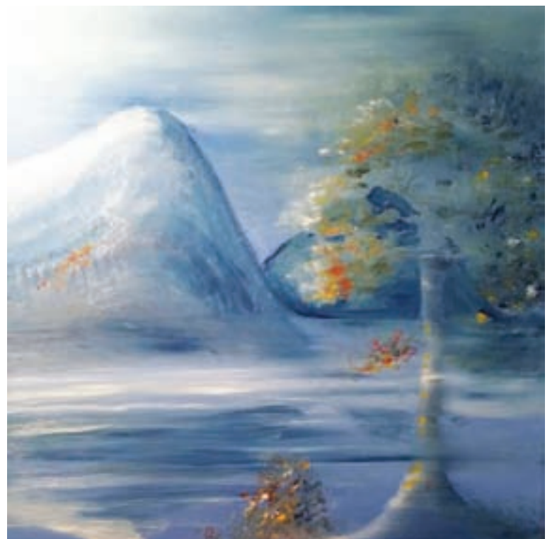
Høstnatt. Lysets og årstidenes stadige skiftninger er fanget på lerretet.