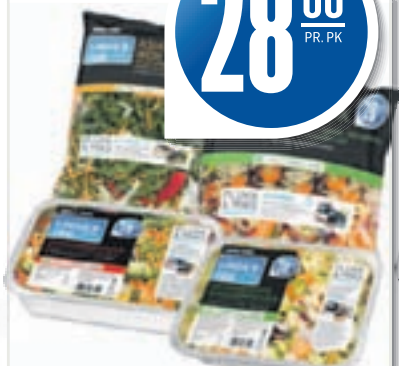
WOK OG OVNSGRØNNSAKER 400-450g, 62,22-70,00 pr. kg