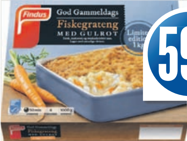
GOD GAMMELDAGS FISKEGRATENG M/GULROT Findus, 1000 g, 59,00 pr. kg