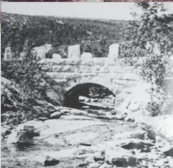
MYE ARBEID og godt arbeid skulle til for å bygge og konstruere ei bru dengang og flotte byggverk ble det! Her er fra Storjordbrua

fester, veibasarer osv til inntekt for planlagte veier og fikk god støtte lokalt og mange møtte på foreningens møter. Veifondet gav økonomiske bidrag til flere veiprojekt i Storjordområdet og da stat og kommune etterhvert overtok ansvaret for veibyggingen av Korsnesveien, ble fondets midler fordelt og restbeløpet på kr 2000 gitt til