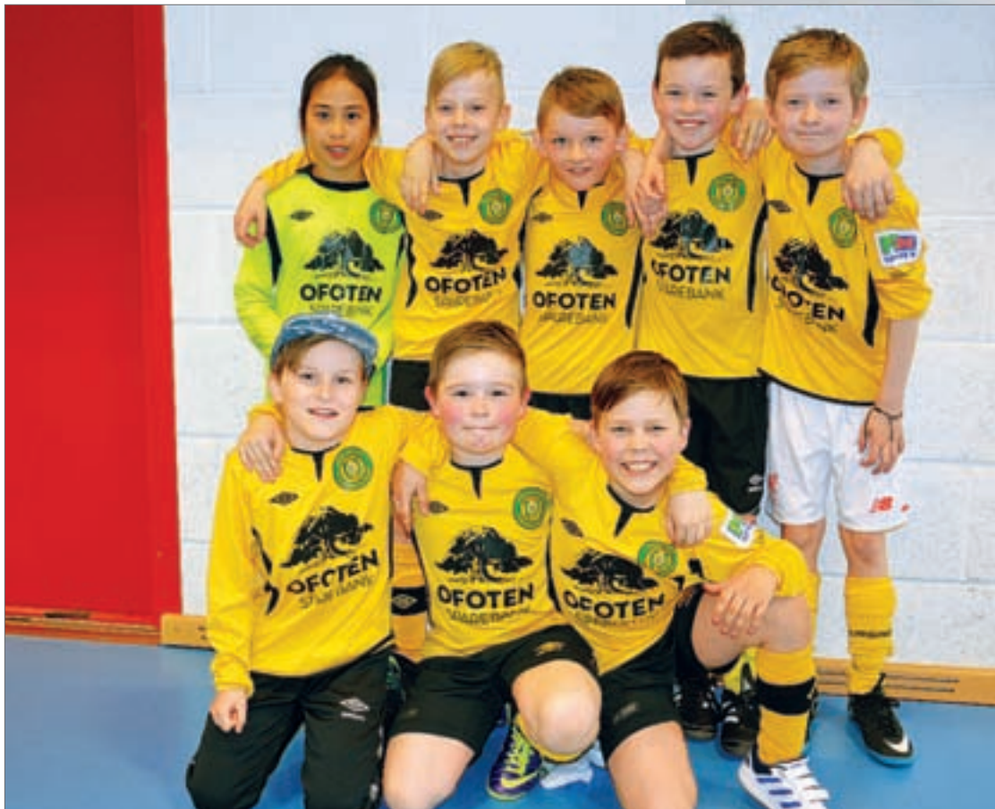
Ballangen MP10. - Det er artig, og slitsomt, sa en godt fornøyd gjeng fra Ballangen, som er glad for å kunne delta på Energicupen i Stetindhallen. De hadde med fem lag og gledet seg stort til at deres egen fotballbane blir spilleklar ute i vårværet.