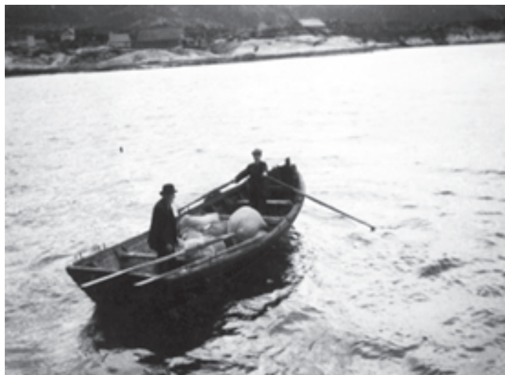
Før veien kom til Korsnes var sjøveien og båten fremkomstmiddel