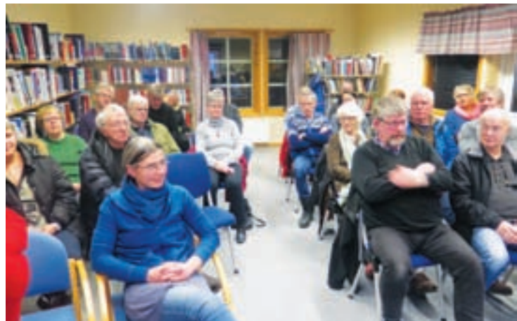
Interessante foredrag. Rundt 30 tilhørere fulgte interessert med i det omtrent timeslange foredraget.