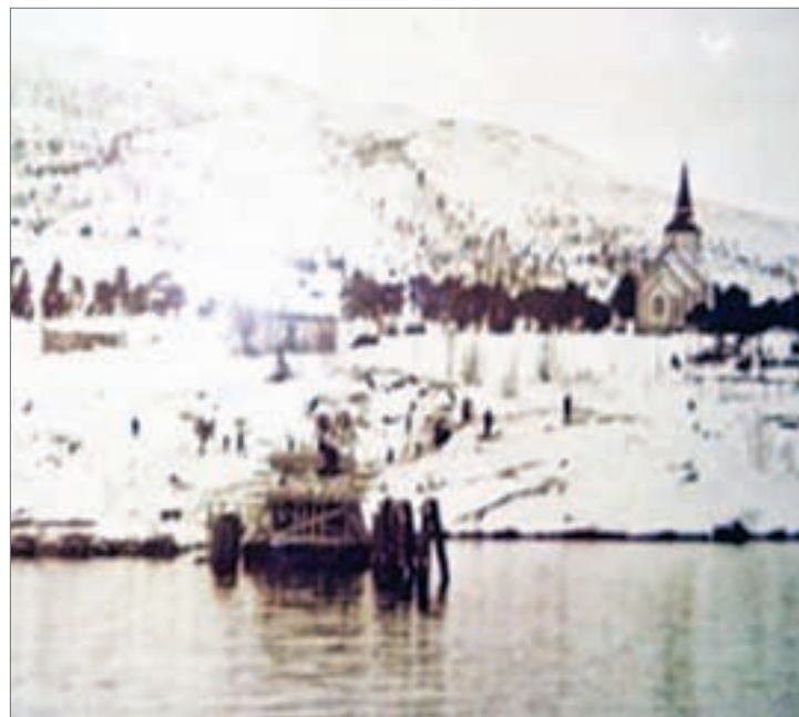
FERGELEIE PÅ KORSNES bygges og den første ferjetrafikken over Tysfjorden kunne starte like før krigen. Det ble lagt ned stor innsats og i 1938 kunne ferjeforbindelsen mellom Korsnes og Skarberget åpnes.