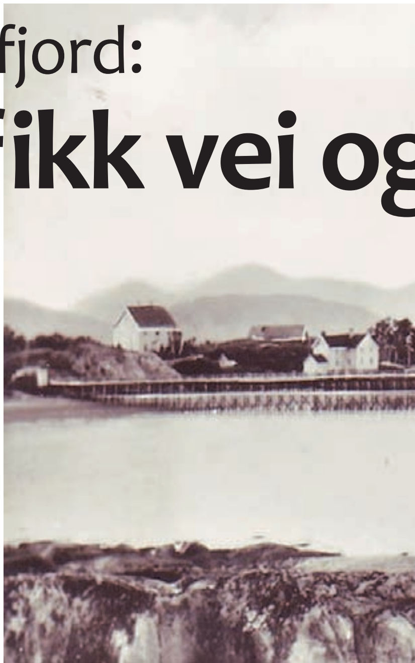
Sentralt sted. Hurtigruteanløp på Korsnes. Postkort, enerett Sverre Norman (uts)