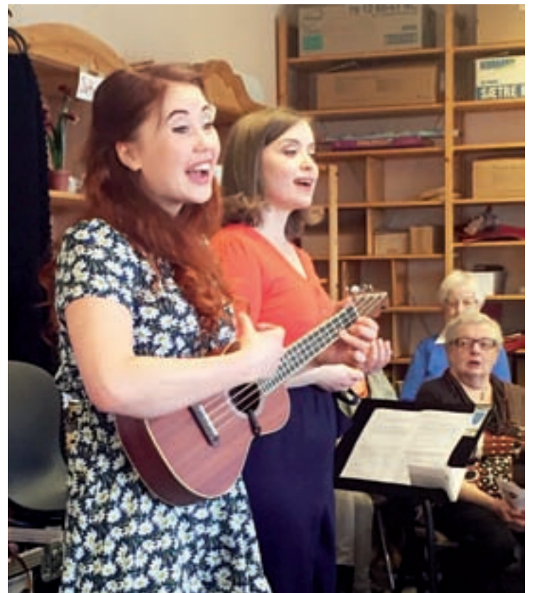
Et meget fornøyd publikum på nærmere femti fikk oppleve en fengende konsert i dag på Trivselsstua på bygdeheimen, Oppeid. Her var det bare kjente låter, gamle slagere og populærmusikk fra Ønskekonserten. Musikken ble profesjonelt framført med en ny snert, med dans og fantastisk opptreden. De nye konsertstedene i Salten, kan bare glede seg. Vi takker Pensjonistforeningen som serverte kaffe og nydelige kaker.