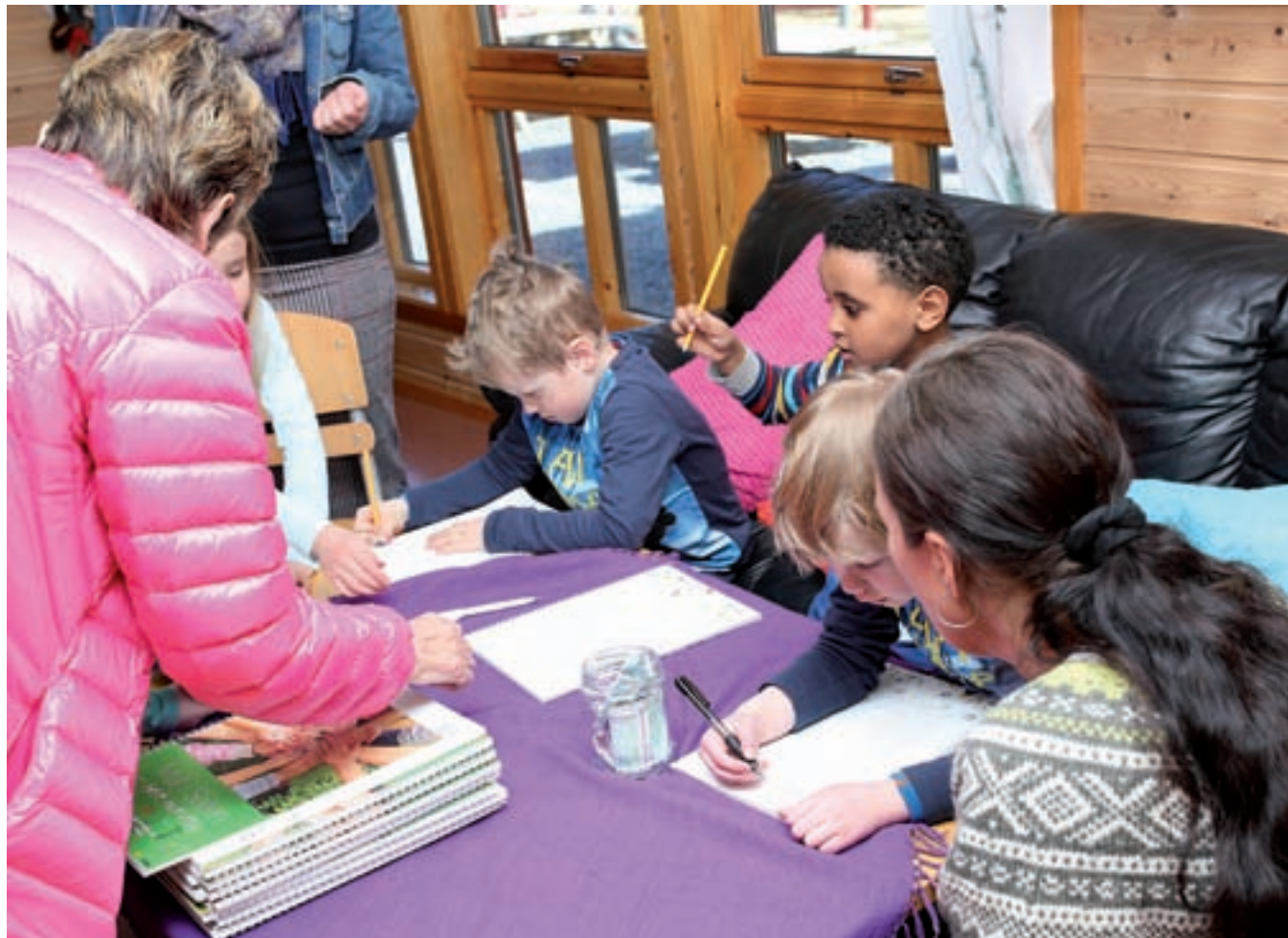
Full rulle. Det var mange som kom innom boklanseringen og ville kjøpe oppskriftsboka. Leinesfjord barnehage har bidratt i.